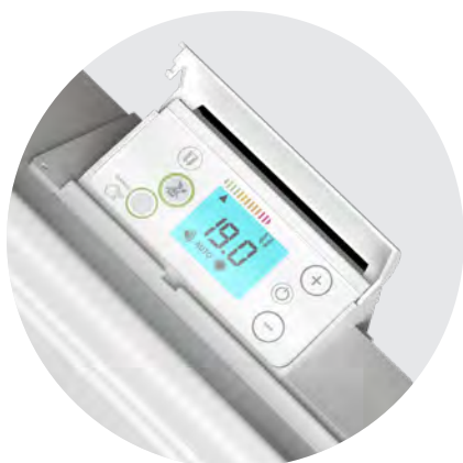
Лесен за управление